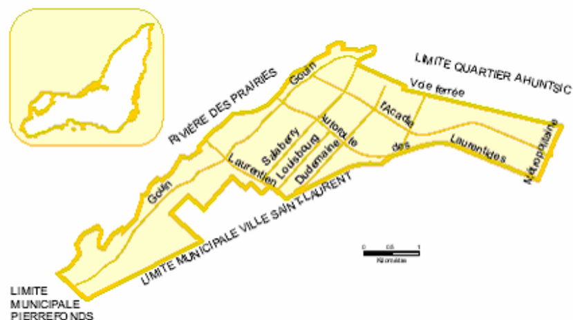
Carte 3 : Localisation du quartier Bordeaux-Cartierville 20

Le quartier Bordeaux-Cartierville est délimité au nord par la rivière des Prairies, à l'ouest par les ex-municipalités de Saint-Laurent et Pierrefonds, à l'est par le quartier Ahuntsic et au sud par la voie ferrée du Canadien National. Bordeaux-Cartierville comprend deux quartiers de planification, Cartierville et Nouveau-Bordeaux. L'une des caractéristiques du quartier, c'est d'être délimité soit par la rivière, soit par la voie du chemin de fer ou soit par des autoroutes (Autoroute 13 et boulevard Métropolitain), ce qui en fait un quartier enclavé, difficile d'accès et isolé des quartiers voisins.