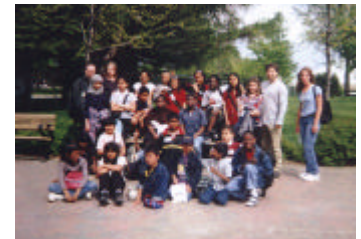
Sortie au jardin botanique avec les enfants de l'école Enfant Soleil