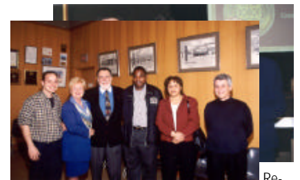
Ordre des Grands Laurentiens