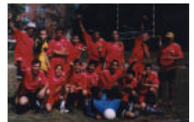
Joute de soccer à l'été 2000

Toutes les activités du volet ont dû être mises en veilleuse à la fin du mois d'août 2000, faute de fonds, à l'exception du projet de « travail de rue » qui s'est poursuivi jusqu'à la fin mars 2001. Avec le travail de rue dont les principaux axes d'intervention sont l'écoute, l'accompagnement, la référence et la médiation, nous avons répondu à un besoin très présent. Plusieurs présences ont été faites par nos travailleurs de rue, en particulier dans " Chameran ". De plus, avec la collaboration de la Ville de Saint-Laurent, nous avons pu offrir dans le chalet du parc Painter un endroit aux jeunes pour pouvoir socialiser. Les résultats furent impressionnants, nous avons pu avec les divers intervenants remarquer une réduction considérable des méfaits commis par les jeunes. Les gardiens de parc se sont sentis rassurés par notre présence et notre travail. Nos intervenants ont également poursuivi leur travail dans les différents parcs de Saint-Laurent, les écoles