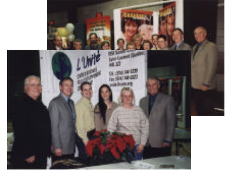
Salon du bénévolat 2000