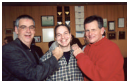
Partie de hockey entre les députés de l'Assemblée nationale et les joueurs des Alouettes de Montréal