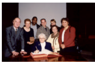
Ordre des Grands Laurentiens