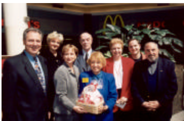
Lancement de la semaine du bénévolat 2001