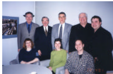
Comité de soutien pour le projet