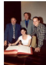
Journée internationale des familles