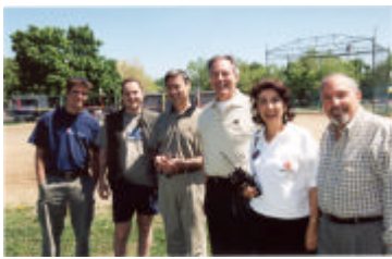
Journée familiale au parc Goyer