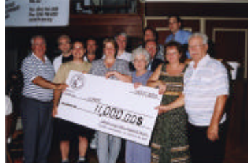
Tournoi de golf du marché Jean-Marc Gravel et fils du 1er août 2000